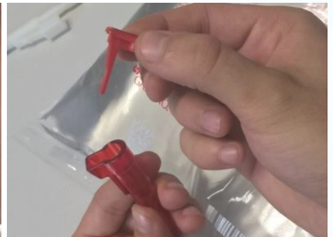
Konnektor ohne Schutzkappe