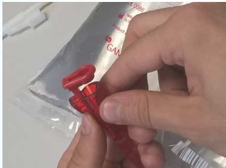
Die Schutzkappe des Konnektors entfernen