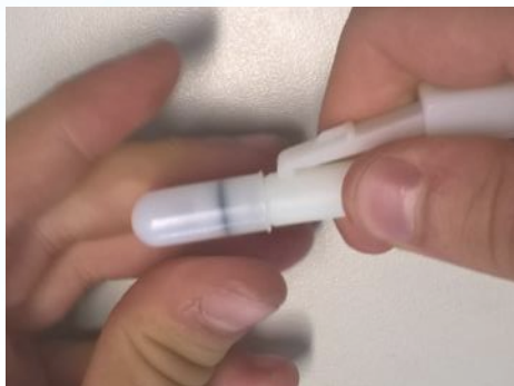
Konnektor mit Schutzkappe