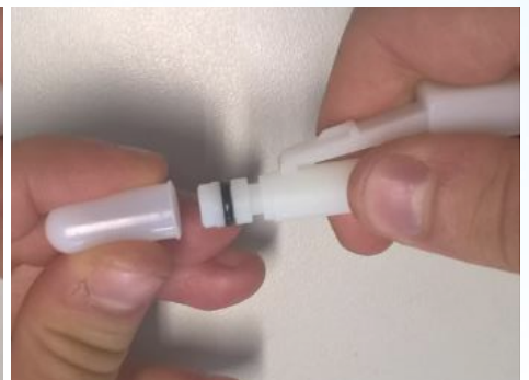
Konnektor ohne Schutzkappe