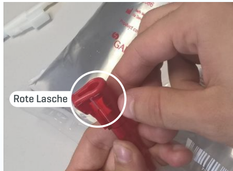
Konnektor mit Schutzkappe

Die Schutzkappe vom Konnektor des Beutels entfernen, hierzu mit dem Finger auf die rote Lasche an der Kappe drücken.