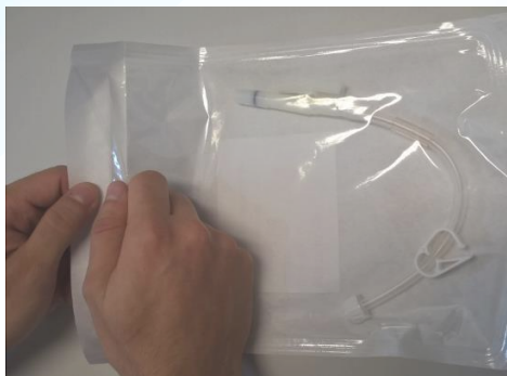
Die Umverpackung öffnen

Die Schutzkappe vom SoftPac Konnektor abziehen.